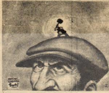
İkinci Balyoz Harekâtı